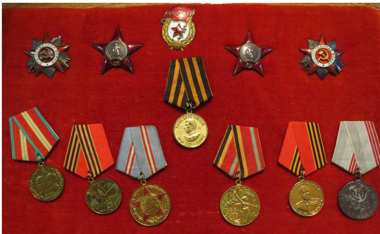
Рисунок 1. Награды моего прадедушки

– боевая медаль «За победу над Германией в Великой Отечественной войне 1941-1945 г.г.».